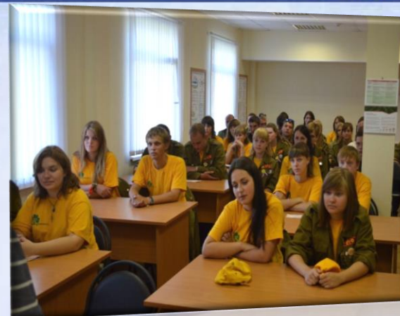
Теоретическая подготовка бойцов