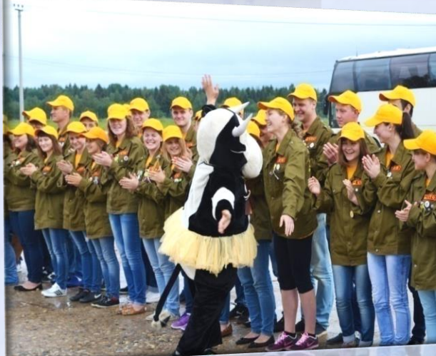
Линейка открытия смены, июнь 2014г.