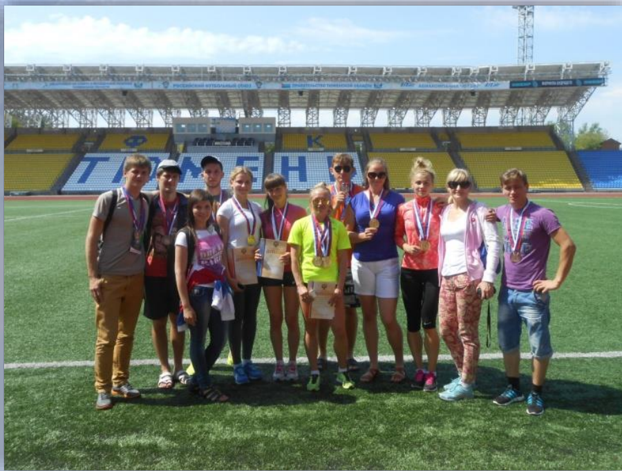
Мужская и женская сборные по легкой атлетике

На V летней Универсиаде мужская сборная по легкой атлетике заняла III место в эстафете 4×100 м женская сборная в эстафете 4×400 м завоевала I место