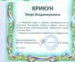
Благодарности администрации ОАО «СХП «Вощажниково»