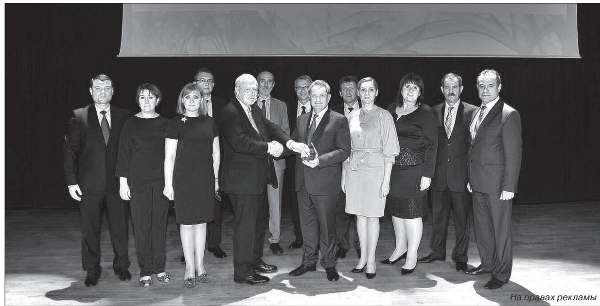
• Делегация Ставропольского государственного аграрного университета на торжественной церемонии с командой ассессоров EFQM.

ли организация в своей стране не является лидером.