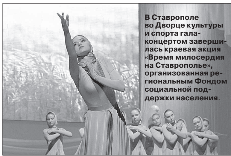
В Ставрополе во Дворце культуры и спорта гала-концертом завершилась краевая акция «Время милосердия на Ставрополе», организованная региональным Фондом социальной поддержки населения.