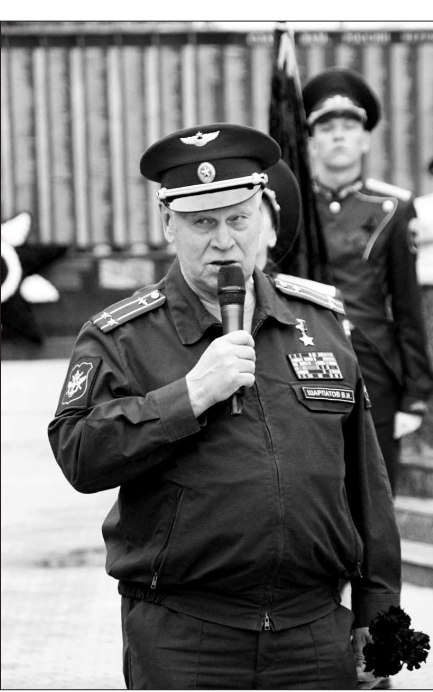
Каждый из двадцати пяти ге-