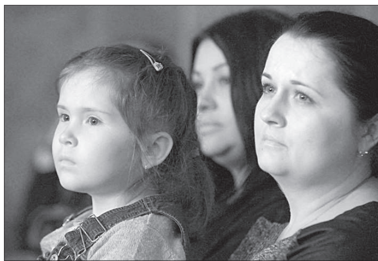
В ЭТОМ году все мероприятия волонтеров были посвящены детям - защите их жизни и здоровью, пропаганде семейных ценностей и традиций, помощи семьям, удалась собрать более 150 тысяч рублей. Как было озвучено, в ближайшее время на эти средства будут куплены спортивные инвентарь и игрушки в детские дома, школы-интернаты и реабилитационные центры. И это еще не все новости! Весной Ставрополь посетили специалисты из Центра лечебной педагогики Москвы, они обследовали 30 детей-инвалидов, дали ценные рекомендации родителям.

Концерт прошел на одном дыхании: со своими номерами выступили творческие коллективы города, состоявшая церемония награждения помощников фонда. В их числе и газета «Ставропольская правда», которая уже не первый год инициирует и проводит мероприятия «Время милосердия» и рассказывает о деятельности фонда. В их числе и газета «Ставропольская правда», которая уже не первый год инициирует и проводит мероприятия «Время милосердия» и рассказывает о деятельности фонда.