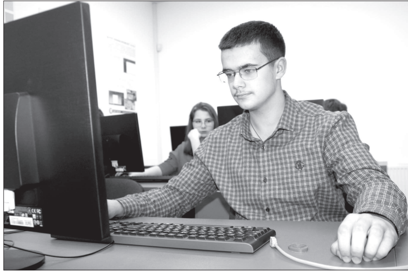
• Центры молодежного инновационного творчества на Ставрополье вовлекают в свою орбиту сотни и тысячи будущих инженеров и ученых.

Ну а развитию сети центров молодежного инновационного творчества правительство Ставрополья и впредь будет уделять первостепенное внимание, благо опыт работы инновационных площадок для будущих инженеров в нашем регионе уже накоплен немалый. Созданием молодежных научных лабораторий занимается министерство экономического развития Ставропольского