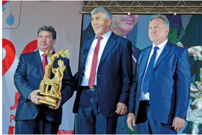
Делегация из Чечни в день празднования Дня города Изобильного и Изобильненского района

Затем грянула перестройка, раздел земли и приватизация крупных хозяйств. В социаль-