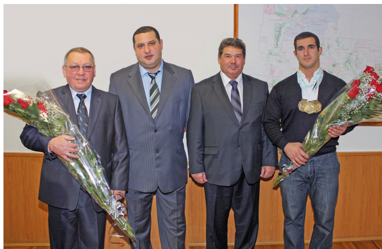
Встреча со спортсменами-тяжелотлетами