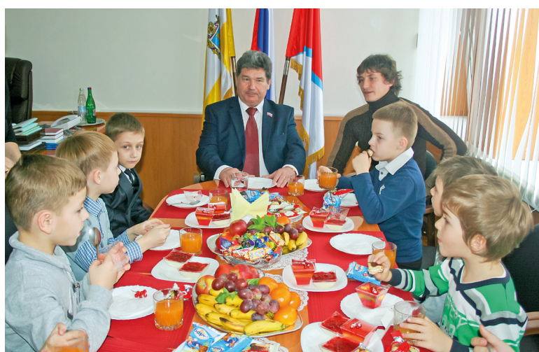
Встреча с детской футбольной командой «Сахарник»

В 2004 году его избрали главой Изобильненского муниципального района.