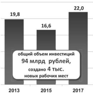
Реализация 50 крупных инвестиционных проектов за 2013-2017 гг.