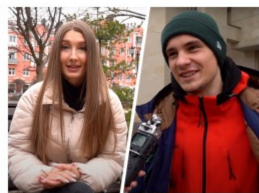
«Потратил все деньги, которые были»: как молодежь Ставрополя шикует на «Пушкинскую карту...