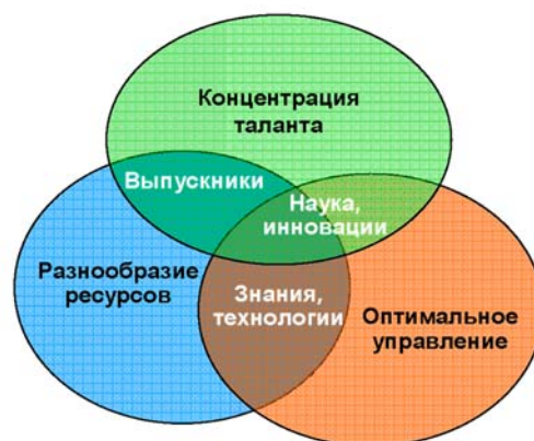
Рис. 2. Факторы критического успеха

Университетом определены факторы критического успеха , которые придают новый импульс деятельности вуза, создавая мультипликативный эффект (Рис. 2. Факторы критического успеха).