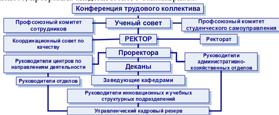
Рис. 3. Управленческая структура Ставропольского ГАУ

Кафедра информационных систем является выпускающей кафедрой по направлению 09.03.02 Информационные системы и технологии, профиль - Информационные системы и технологии в бизнесе, программа академического бакалавриата.