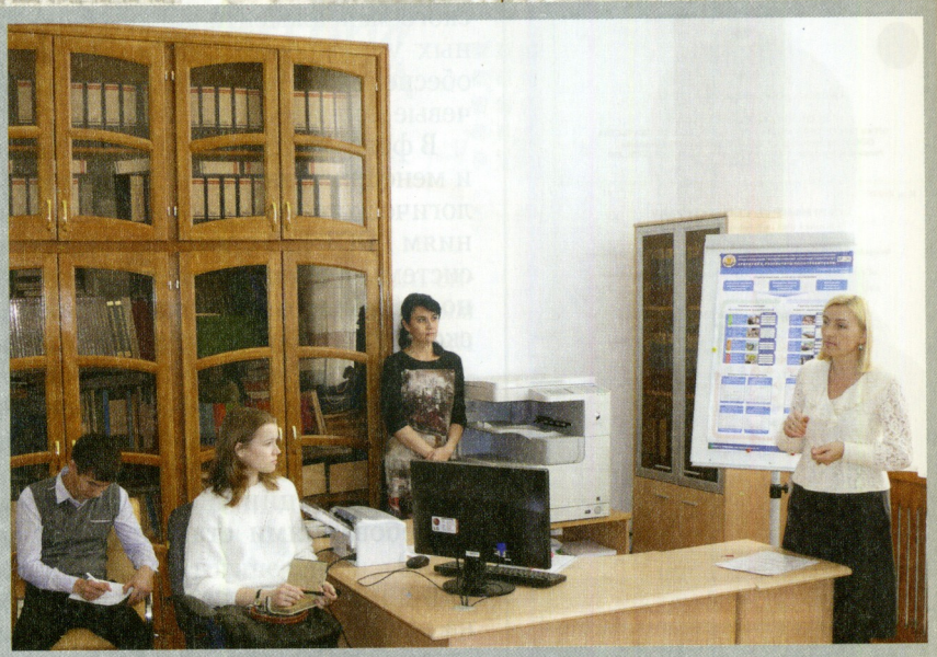
Совместно со студенческими комиссиями по качеству факультетов проводится изучение общественного мнения в студенческой среде

Из 30 тысяч организаций, применяющих модель EFQM в Европе, Ставропольский государственный аграрный университет вошел в четверку рекомендованных для изучения положительной практики в работе с потребителями и персоналом для других организаций Европы и России. Начиная с 2009 года в ежегодном сборнике «Лучшие практики организаций – лидеров Европейского качества EFQM» публикуются результаты анкетирования студентов и сотрудников Ставропольского государственного аграрного университета как ролевая модель для бенчмаркинг-сравнений.