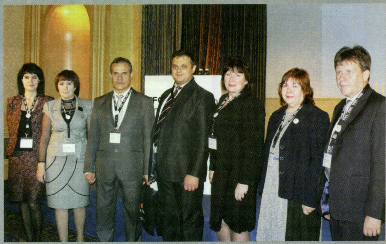
Форум EFQM – 2013 (г. Вена, Австрия)

Сотрудники ЦУКО проводят обучение специалистов предприятий, организаций и других слушателей в области менеджмента качества. Так, в период с 2008 по 2015 год проводилось обучение и консультирование по вопросам менеджмента качества и делового совершенства более 1200 сотрудников учреждений высшего и среднего профессионального образования Ставропольского и Краснодарского края, Кабардино-Балкарской Республики, Республики Северная Осетия – Алания, Брянской области.