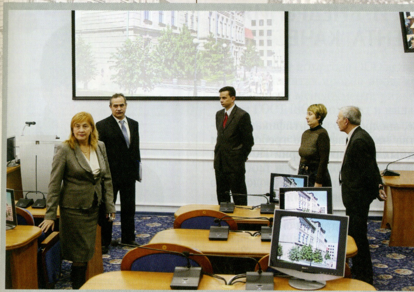
Эксперты Рособнадзора в Ставропольском ГАУ (2014 г.)

о том, что работодатели и инвесторы уверены в качестве образовательной деятельности и высоком уровне подготовки выпускников Ставропольского ГАУ.