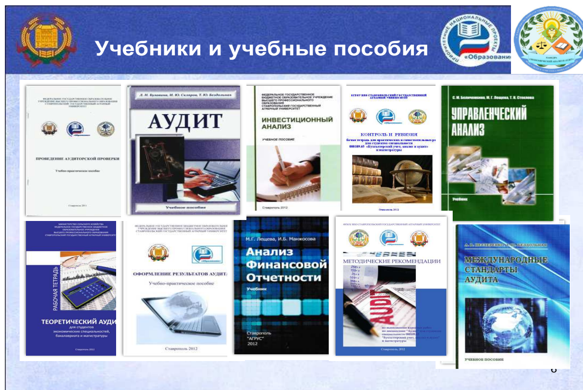
Рисунок 1 – Учебники и учебные пособия, подготовленные преподавателями кафедры

В то же время, сохраняется потребность в регулярных закупках новейшей специальной (монографической и справочной) литературы.