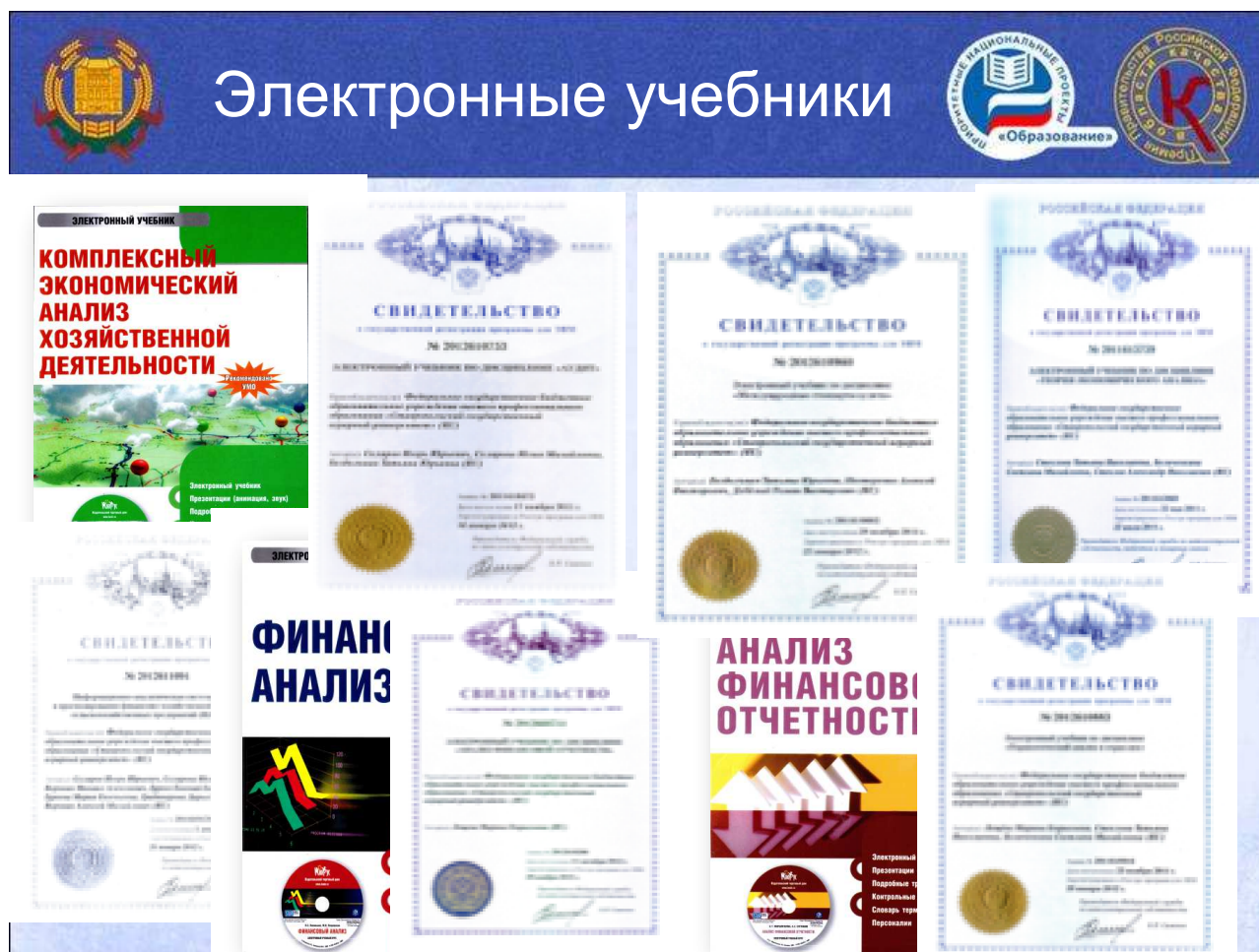
Рисунок 2 – Электронные учебники, подготовленные преподавателями

Общее количество изданных учебно-методических разработок за отчетный период составило 123 тиражом 26800 экземпляров и общим авторским текстом в объеме 516,6 п. л. Таким образом, в среднем на 1 преподавателя приходится 8,2 учебно-методических разработок и учебных пособий объемом 1786,6 п.л. тиражом 34,4 экземпляров.