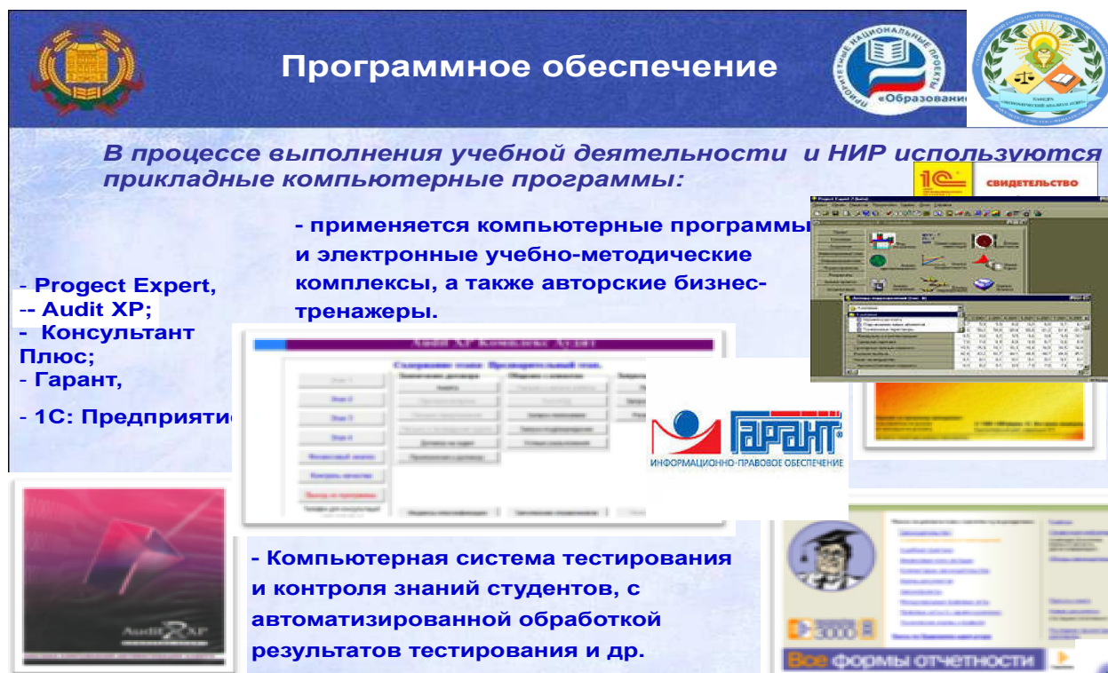
Рисунок 3 – Программное обеспечение образовательного процесса

На выпускающей кафедре имеются средства вычислительной техники и программного обеспечения, которые позволяют повысить качество подготовки специалистов по направлению «Экономика» профиль «Финансовый аналитик»