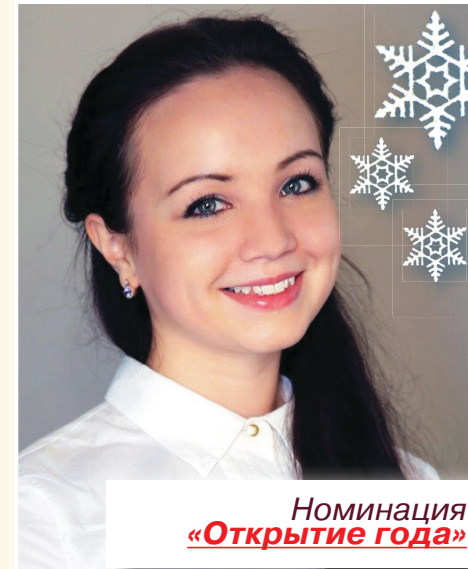
Номинация «Открытие года»

Чего я хочу пожелать всем сверстникам? Живите звонко! Так, чтобы смех – во всю силу лёгких, чтобы учёба и работа – по душе. Любите самозабвенно, выступайте до гroma аплодисментов, дружите вечно. И пусть всё это свершится под яркими цветами радуги! Наслаждайтесь силой и красотой своей юности, ведь пока жизнь вам не нравится, она проходит мимо. Поверьте, через 40 лет мы посмотрим на свои фотографии и вспомним с чувством, которого сейчас не понять, сколько возможностей было открыто перед вами и как же сказочно вы на самом деле выглядели.