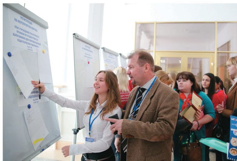
Идёт регистрация студентов, выпускников, наставников, будущих работодателей молодых аграриев. На форум в СтГАУ прибыло более 250 человек из восьми федеральных округов!

Как поняли присутствующие студенты агроколледжей и техникумов, важна и высокая психологическая готовность к принятию решений, и желание постоянно повышать свою квалификацию... Словом, работать нужно так, чтобы глаза горели .