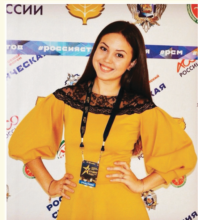
Номинация «Студенческий лидер»

Призёр VI Международной студенческой электронной научной конференции «Студенческий научный форум – 2014».