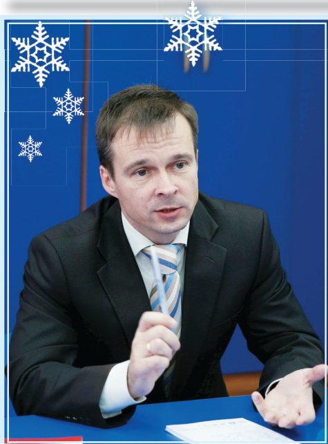
Заместитель начальника отдела кадров по работе с персоналом ООО «Агрофирма «Золотая нива»