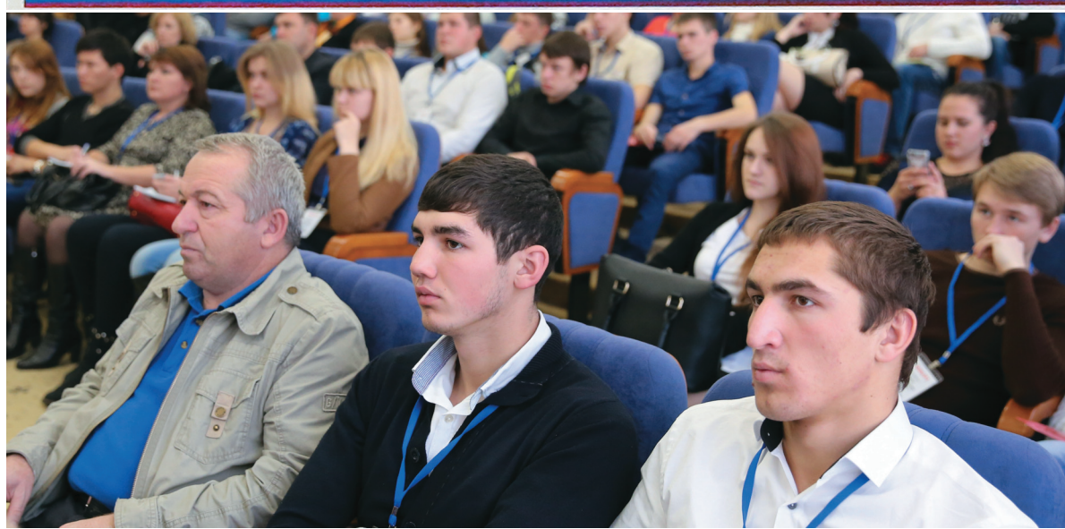
Для всех участников форум стал источником новых идей, площадкой для перспективных переговоров и обмена опытом в сфере трудоустройства.