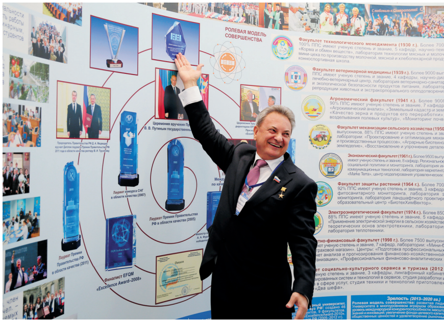
На новый уровень Совершенства

Наивысший – платиновый – уровень признания Совершенства (свыше 700 баллов!) получил Ставропольский государственный аграрный университет в проекте «Глобальный индекс Совершенства» Европейского фонда менеджмента качества (EFQM «Global Excellence Index»)