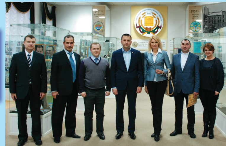
Председатель Российского союза молодежи П. П. Красноруцкий (в центре) и сотрудники СтГАУ в музее истории университета

учёных, сотрудников вуза, стоящих у истоков его основания, но и большое количество представленных наград нашего университета. Среди них – две награды высшего достоинства: золотая медаль «Европейское качество» в номинации «100 лучших вузов России» и орден Дружбы, врученный Президентом Российской Федерации