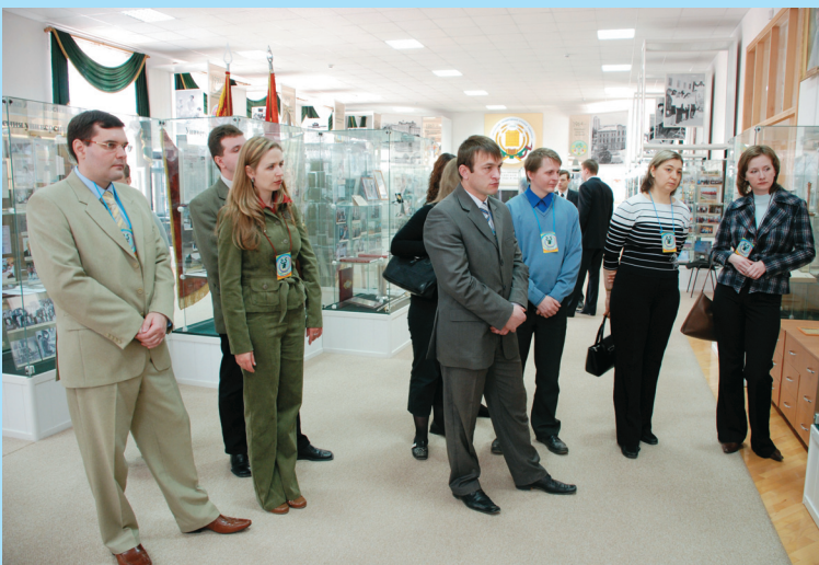
Участники конференции Совета молодых ученых знакомятся с историей университета

Неизменный интерес (о чём свидетельствует и книга отзывов) у посетителей музея вызывают не только многочисленные выставки, круглые столы и научные чтения, личные коллекции выдающихся