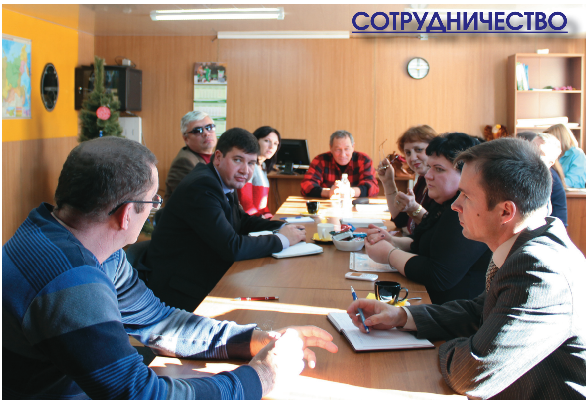
Идёт производственное совещание на базе агрофирмы «Золотая Нива» с участием представителей Ставропольского ГАУ и иностранных специалистов.