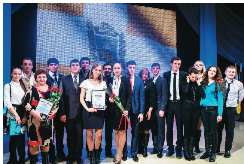
НА I ПАТРИОТИЧЕСКОМ ФОРУМЕ СТАВРОПОЛЬСКОГО КРАЯ. Активисты клуба «Патриот» (в центре) вместе с представителями СтГАУ.