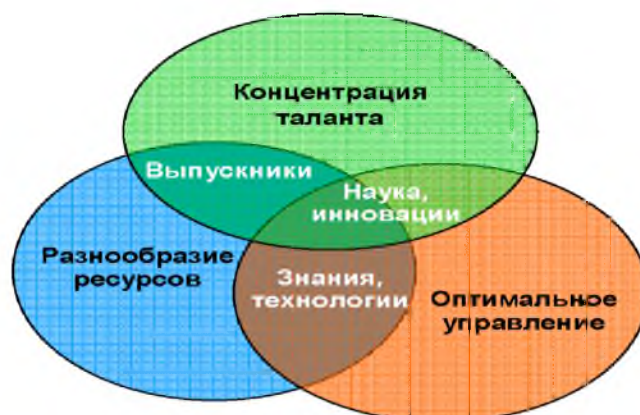
Рисунок 2 - Факторы критического успеха, всех направлений деятельности факультета социально-культурного сервиса и туризма

Основой успешной реализации циклического механизма стратегической деятельности факультета социально-культурного сервиса и туризма являются его конкурентные преимущества, реализация которых базируется на своевременном и адекватном учете существенных вариаций факторов успешности всех видов деятельности факультета (рисунок 2).